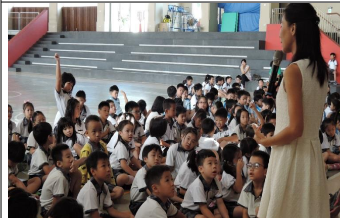
講師到台下與學童互動